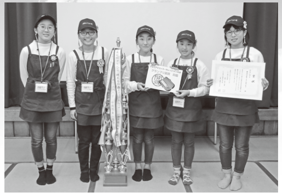
昨年グランプリチーム